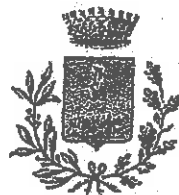
Praia a Mare Comune Capofila