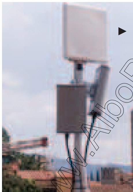
Punto di Accesso con Pannelli