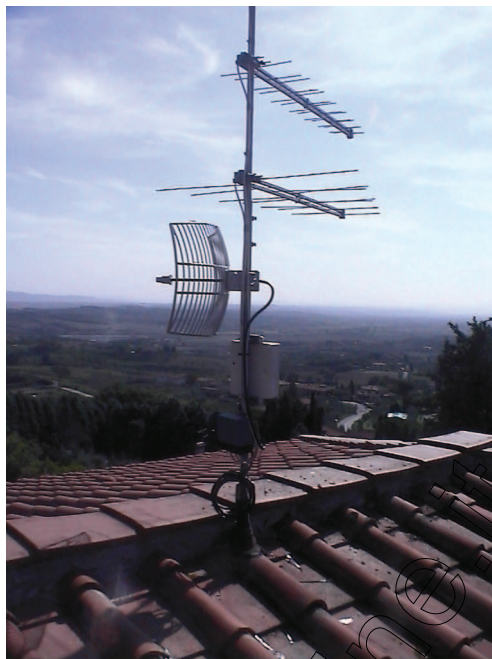
PUNTO DI ACCESSO CON ANTENNA A GRIGLIA