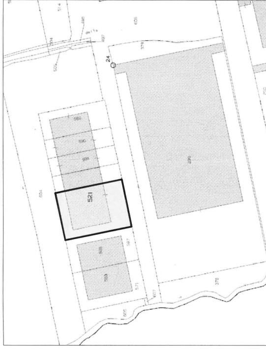
ESTRATTO MAPPA Fig. 4 mapp. 521 sub 503