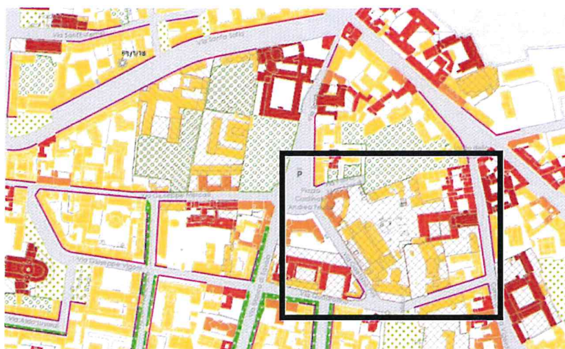
Stralcio P.G.T.-PdR Tav. R02 VAR_Indicazioni Morfologiche

Il Presidio ospedaliero è ubicato nell'area nord-est di Milano, tra via Quadronno, via Gaetano Pini e piazza Cardinal A. Ferrari, nell'ambito territoriale del Municipio 1, all'interno dell' "AREA C".