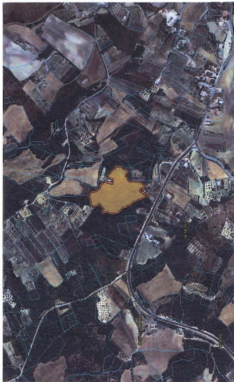
CARTOGRAFIA LOCALITA' LAGHI E FELCI