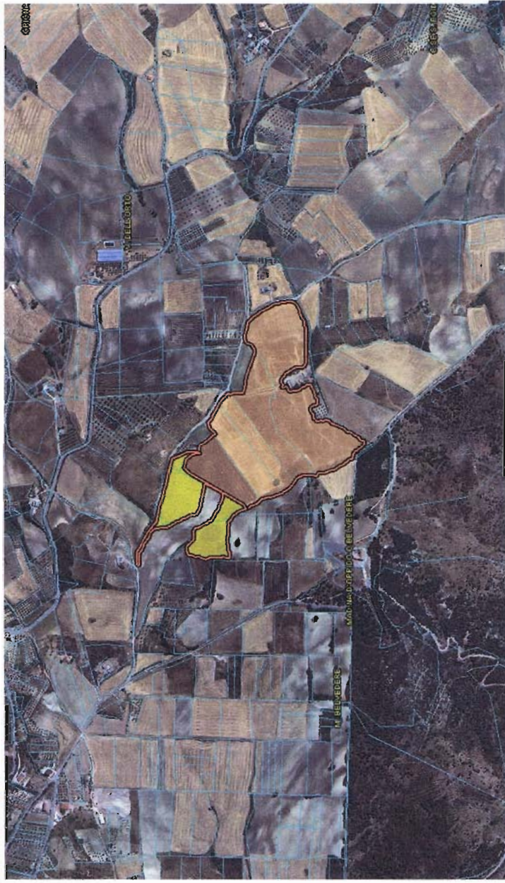
CARTOGRAFIA INCENDIO LOCALITA' PIANARELLA