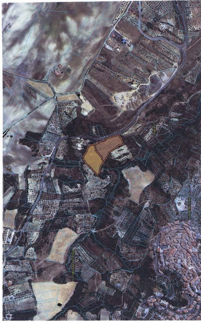
CARTOGRAFIA AREA LOCALITA' FONTANA VECCHIA