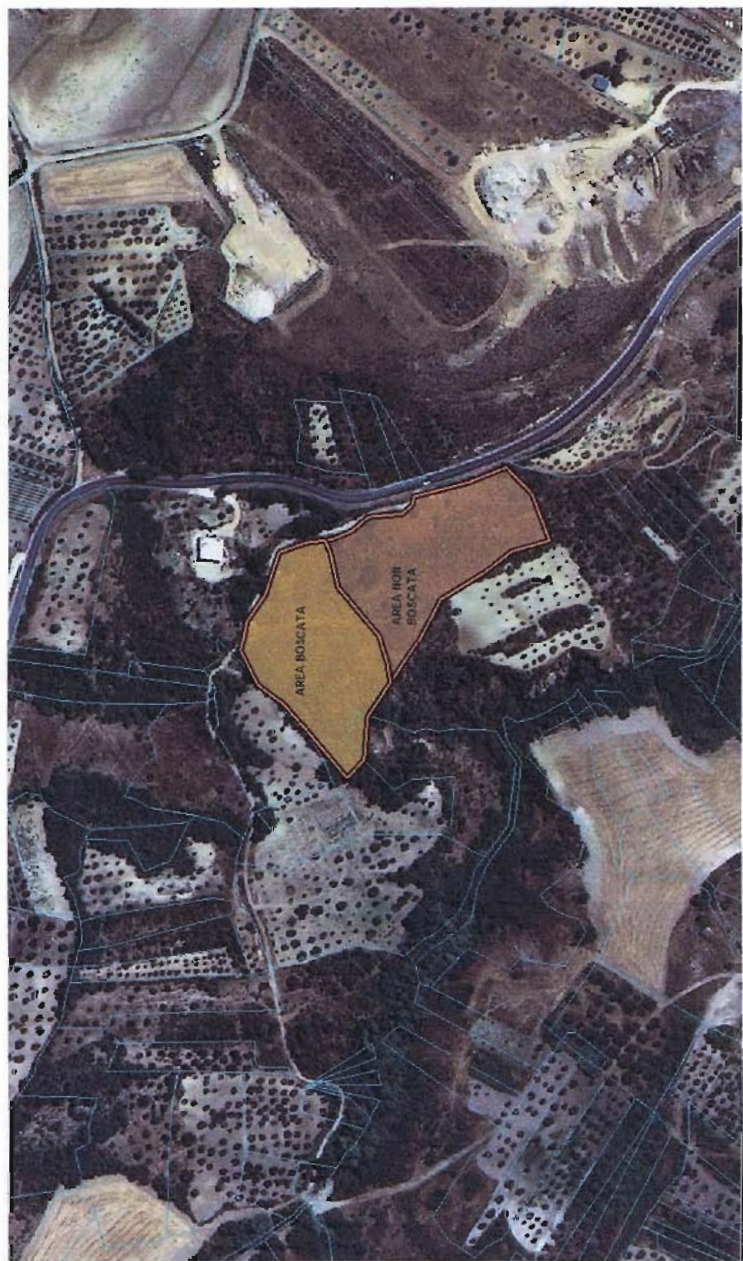
CARTOGRAFIA LOCALITA' FONTANA VECCHIA DETTAGLIO INCENDIO