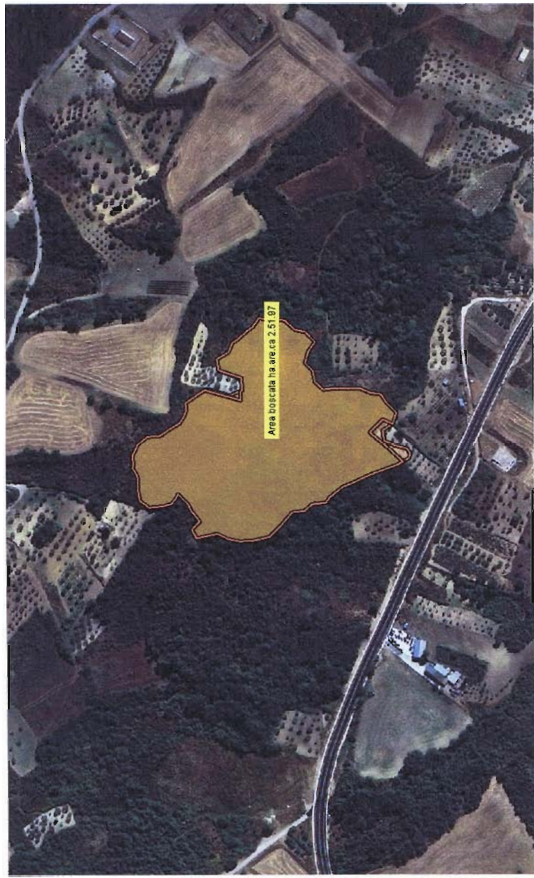
CARTOGRAFIA LOCALITA' LAGHI E FELCI DETTAGLIO INCENDIO