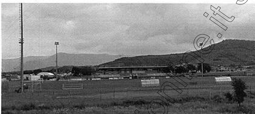
Foto n°3 Vista dalla S.R. 156 – campo di calcio con vista tribune